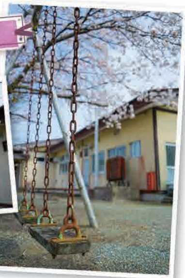
北部コミュニティセンター(鴻草)