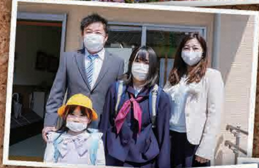
4月6日(水) ふたば幼稚園入園式、 双葉南・北小学校、 双葉中学校 入学式 (いわき市)