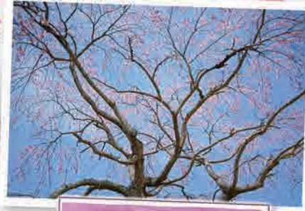
寺内前周辺(長塚二)