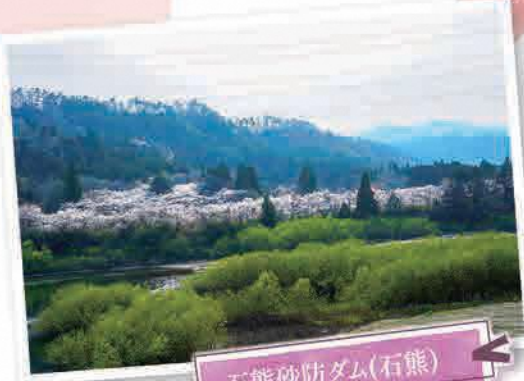
石熊砂防ダム(石熊)