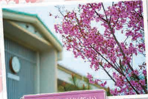
双葉南小学校(新山)