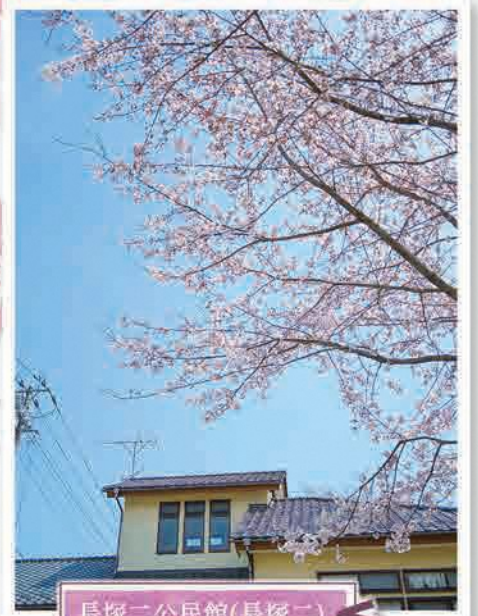
長塚二公民館(長塚二)