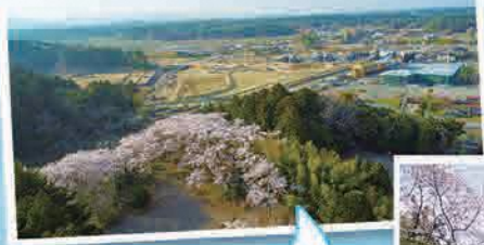
図書館の桜や 新山城跡などへ、 子どもを自転車に 乗せておにぎりを 持って、お花見に 出かけました