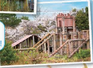
越田アスレチック広場 でのお花見祭りや バーベキューが懐かしい!