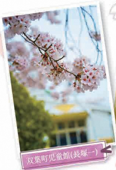
双葉町児童館(長塚一)