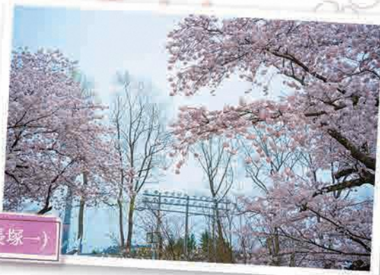
町民グラウンド(長塚一)