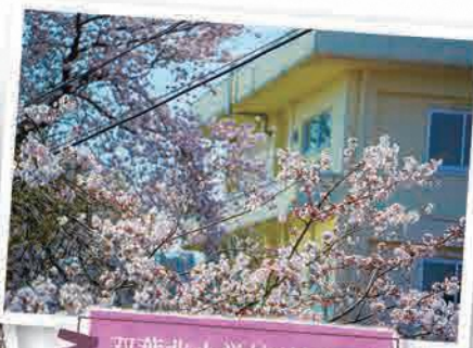
双葉北小学校(長塚二)