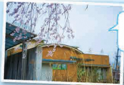
石田医院の しだれ桜が きれいだった!