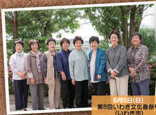
6月5日(日) 第8回いわき文化春祭り (いわき市)