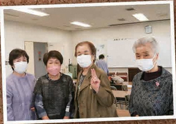
6月10日(金) 柗檀学級陶芸教室 (福島市)