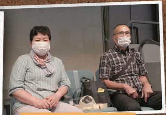
6月19日(日) ふくしま太鼓フェスティバル2022 (郡山市)