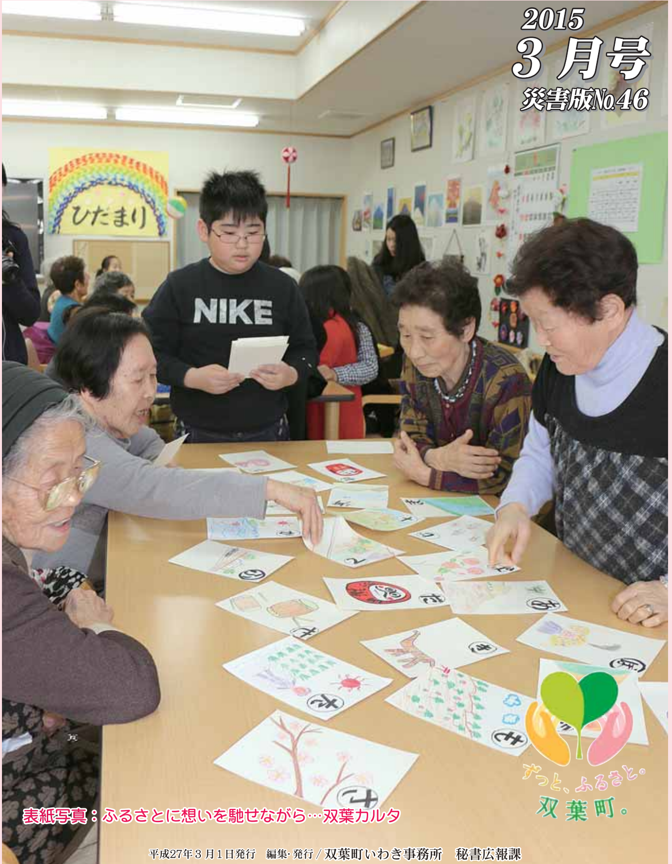
表紙写真：ふるさに想いを馳せながら…双葉カルタ