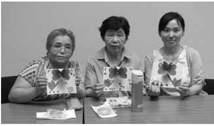
▲8月6日 つくば生活学級 飛び出すカード

来年度も生涯学習係では、避難生活にあっても数多くの方々が気軽に参加し、自主的に学べる充実した内容を計画していきたいと考えています。