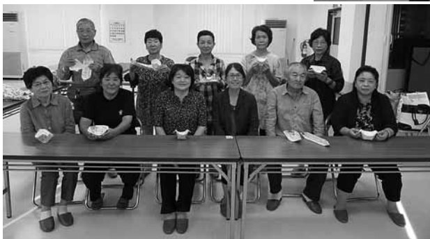
◀ 9月26日 防災講座 かぞ生活学級