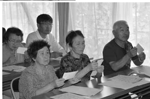
◀ 9月2日 防災講座 しらかわ生活学級