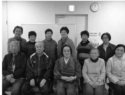
10月14日 みなみだい生活学級 そば打ち体験