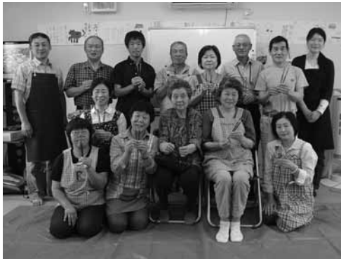
▲6月17日 あいづ生活学級 漆塗り