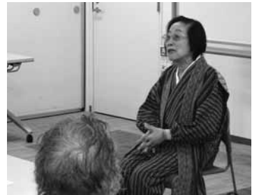
◀▲11月25日 ふくしま生活学級 民話