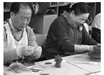
◀▲12月4日 こおりやま生活学級 陶芸教室