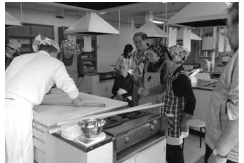
▲10月15日 いわき生活学級 そば打ち体験