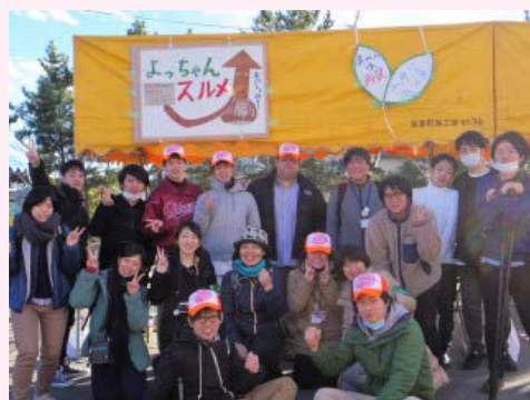
「ぐるぐるユニット」 ダルマ市