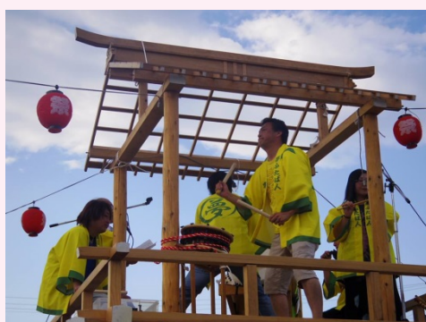
「夢ふたば人」 盆踊り