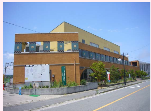
双葉町コミュニティセンター外観