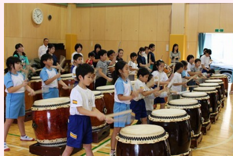
小中合同の和太鼓の練習