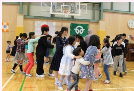
「ふれあい集会」の様子