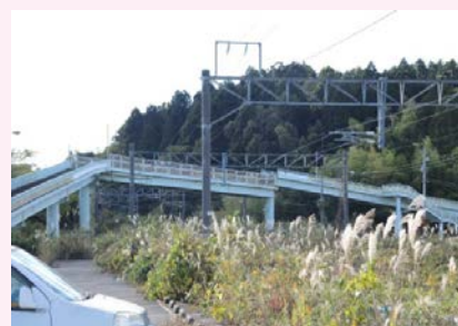
JR 双葉駅近くの歩道橋