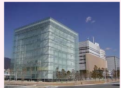
人と防災未来センター外観 (兵庫県博物館協会事務局ホームページより)