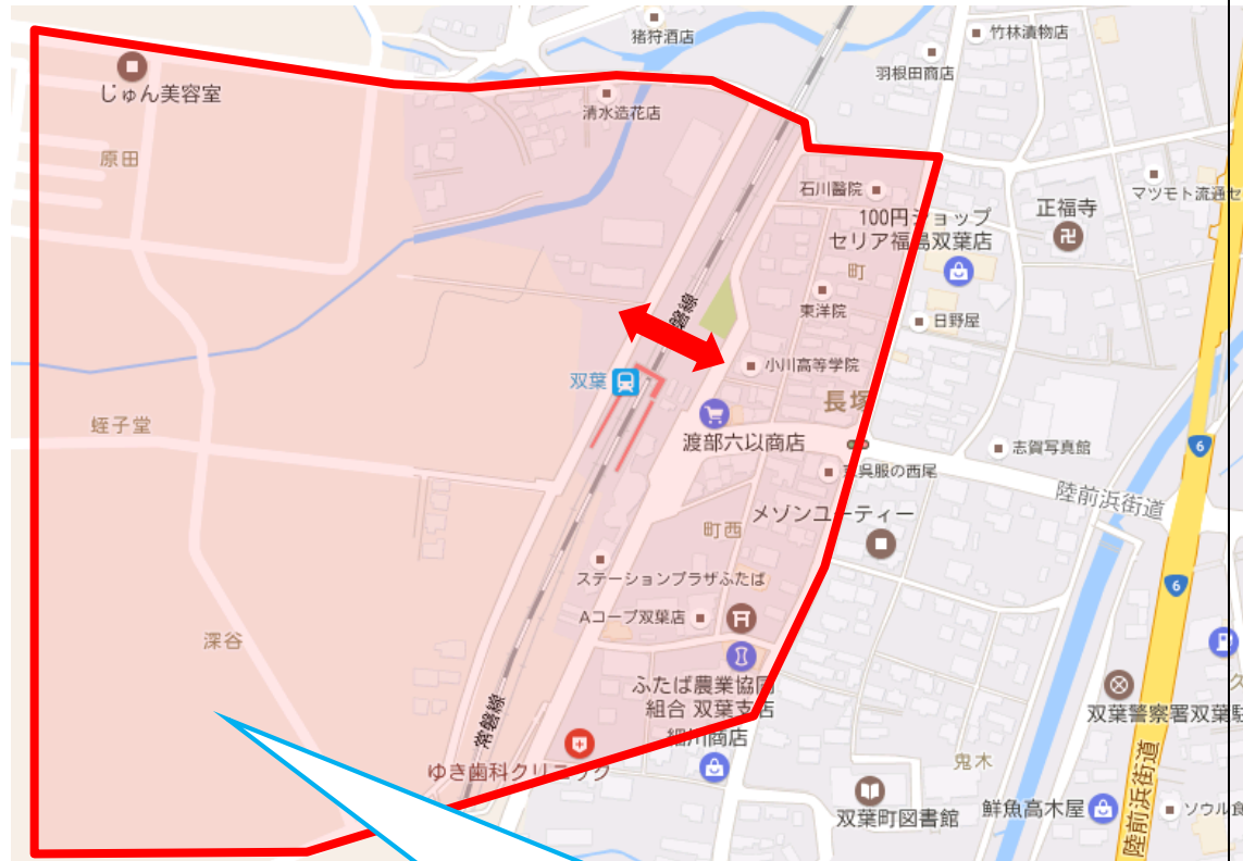
No.26 双葉駅西側地区生活拠点等下水道整備事業【基金】