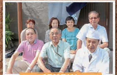
8月23日(木) 東京ふれあい双葉会役員会 (立川市)