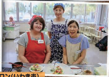
8月23日(木) 栄養サロン(いわき市)