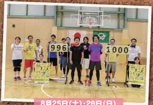
8月25日(土)・26日(日) 1000点インディアカ (いわき市)