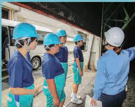
常磐共同火力株式会社

双葉町役場いわき事務所を訪れた際には、職員から双葉町の歴史や特産品などについて説明を受け、その後、庁内の各課をまわりそれぞれの業務内容について説明を受めました。秘書広報課で、町内の3Dレーザー測量の映像を見た際には「個人宅でも3Dレーザー測量はできますか」など積極的に質問していました。