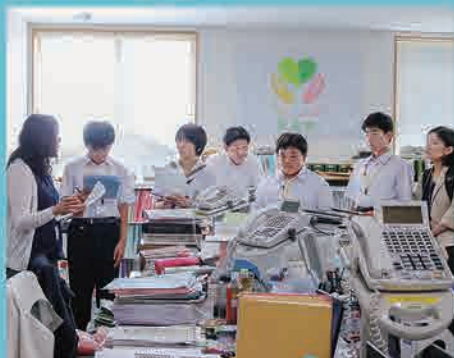
双葉町役場いわき事務所