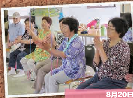
8月20日(月) 社協いきいきサロン夏祭り(加須市)