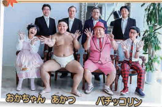
おかちゃん あかつ パチッコリン