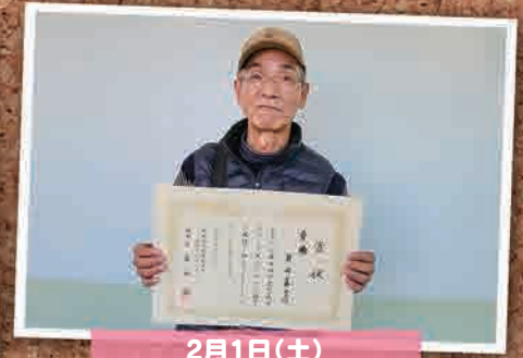
2月1日(土) 双葉町民ボウリング大会 (いわき市)