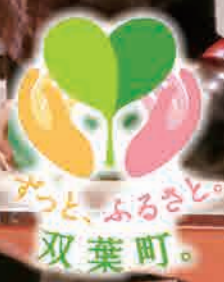
表紙は双葉町民ボウリング大会(いわき市)

コミュニティ情報紙「ふたばのわ」は、 町民皆さんとそれを支える全ての人を巻き込み それぞれの思いやあらゆる情報に 共有・共感できる紙面をめざしています。 月に一度、ふたばのわのページをめくって みんなと一緒に笑顔になりませんか。