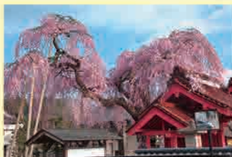
妙閑寺 (白河市)