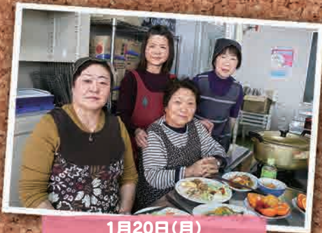
1月20日(月) しらゆり婦人学級料理教室 (南相馬市)