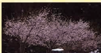
桜平山 (南相馬市)