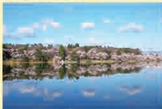
五百淵公園 (郡山市)