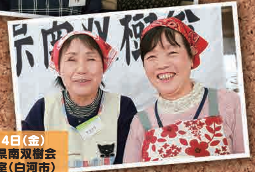
2月14日(金) 双葉町県南双樹会 料理教室(白河市)