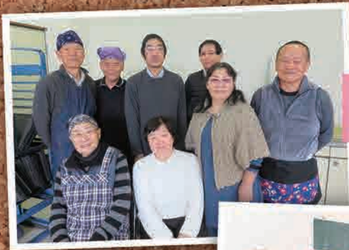
2月12日(水) 男の料理教室 (加須市)