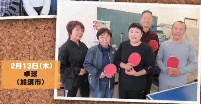
2月13日(木) 卓球 (加須市)