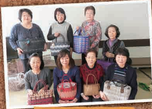
1月30日(木) エコクラフト教室(加須市)