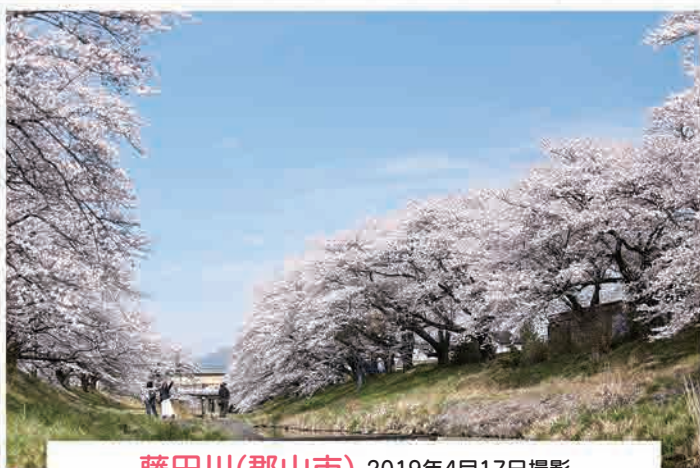
藤田川(郡山市) 2019年4月17日撮影

郡山市の藤田川の桜です。藤田川は、昨年からはじめましたが、とても良い場所です。堀之内橋から下流の方も、整備が進んでいて、これからが楽しみです。毎年撮り続けたいと思っています。