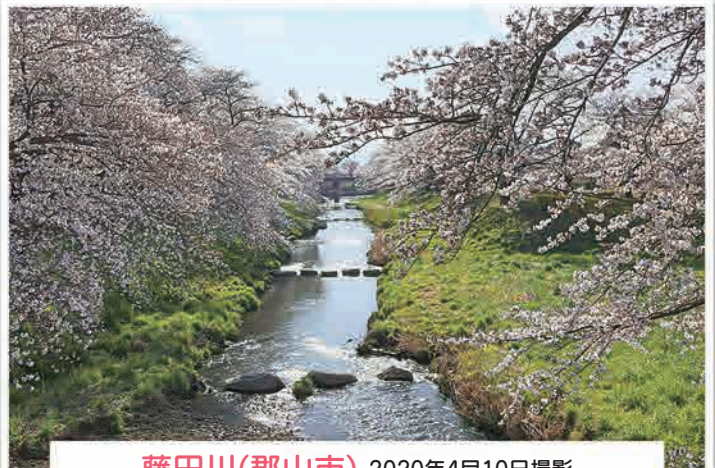
藤田川(郡山市) 2020年4月10日撮影