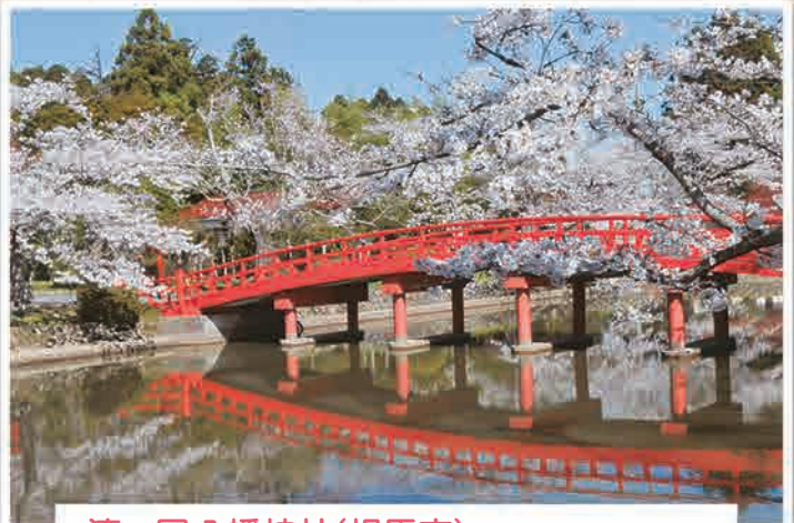
涼ヶ岡八幡神社(相馬市) 2017年4月14日撮影