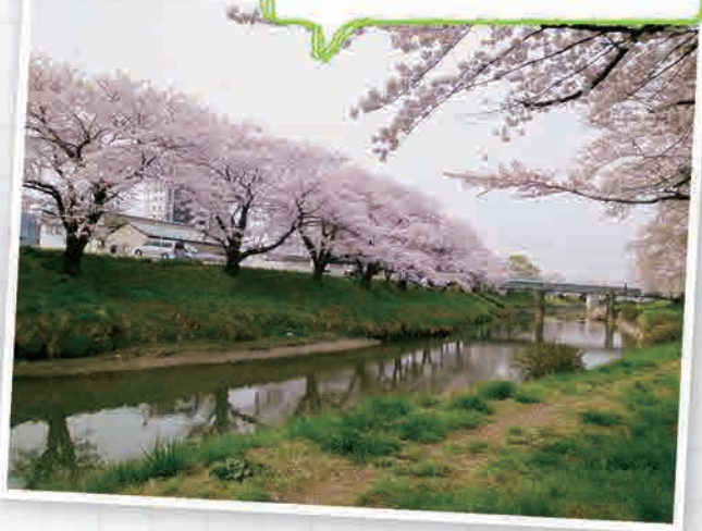
郡山市の中心を流れている 逢瀬川 おうせ の桜並木です。 (2018年4月12日撮影)