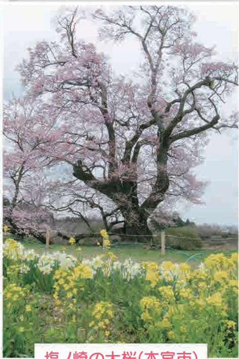
塩ノ崎の大桜(本宮市)

(右)正法寺の桜は他の桜と比べて断然色が白いことで有名です。(左)急な上り坂を登ってみると意外と大きな桜で驚きました。