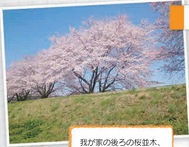
夕陽が丘2丁目さん