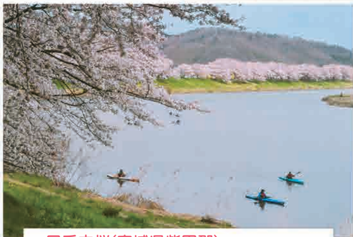
一目千本桜(宮城県柴田郡) 2017年4月15日撮影

(右)家から近いのでしょっちゅう行っています。風のない日を狙い、3日通って撮影しました。(左)震災前、何度も訪れていました。また写真を撮りに行きたいと思い、震災後に訪れた時の写真です。桜が素晴らしいです。