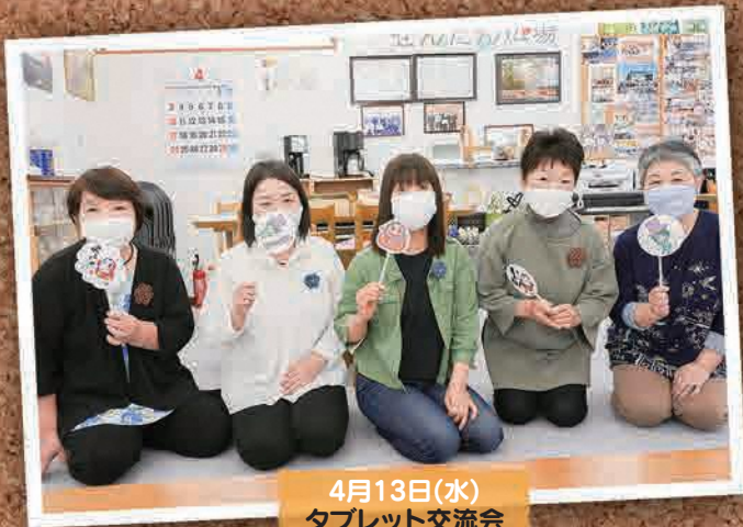
4月13日(水) タブレット交流会 (郡山市)