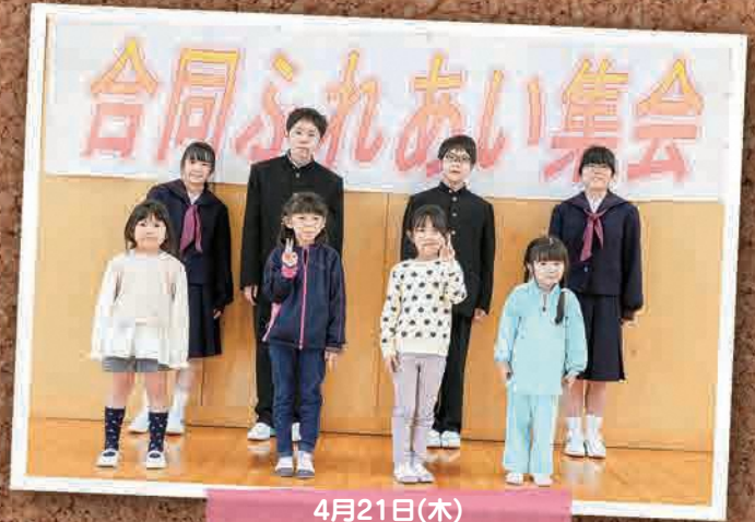
4月21日(木) 双葉町立学校ふれあい集会 (いわき市)