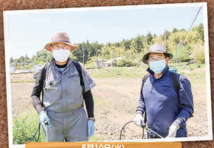
5月10日(火) 上羽鳥地区農地保全管理実行組合除草作業 (双葉町内)