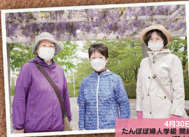
4月30日(土) たんぼぼ婦人学級 開級式&ウォーキング (郡山市)