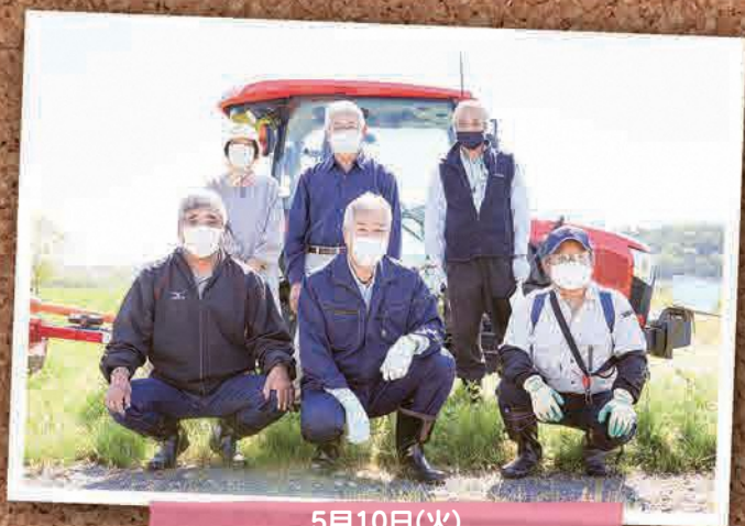
5月10日(火) 三字地区農地保全管理組合除草作業 (双葉町内)