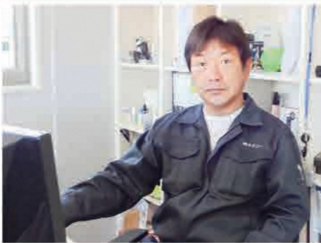
※撮影時のみマスクを外していただいております。

2022年6月以降の特定復興再生拠点区域の避難指示の解除にともない、双葉町の復興はより一層加速され、これから双葉町に帰還される町民の方々や新しく移住して来られる方が増えると思いますので、今後の双葉町の賑わいを楽しみにしています。当社も双葉町立地企業の一員として、コミュニティ活動や地域住民との関係構築等のイベントには積極的に関わってきており、今後も引き続き双葉町の活性化のため、貢献していきたいと思っております。