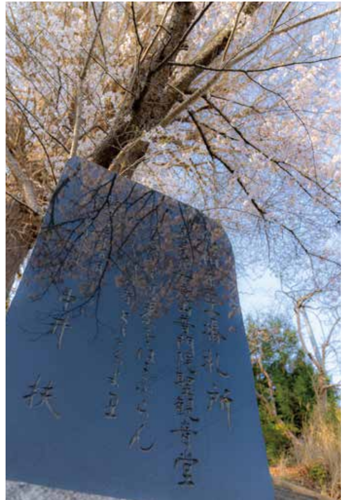
⑫上羽鳥観音堂（羽鳥）