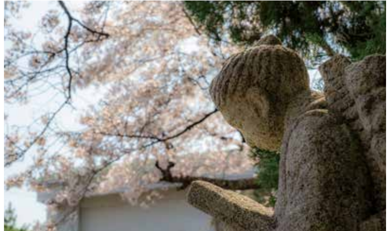
⑦双葉南小学校 (新山)