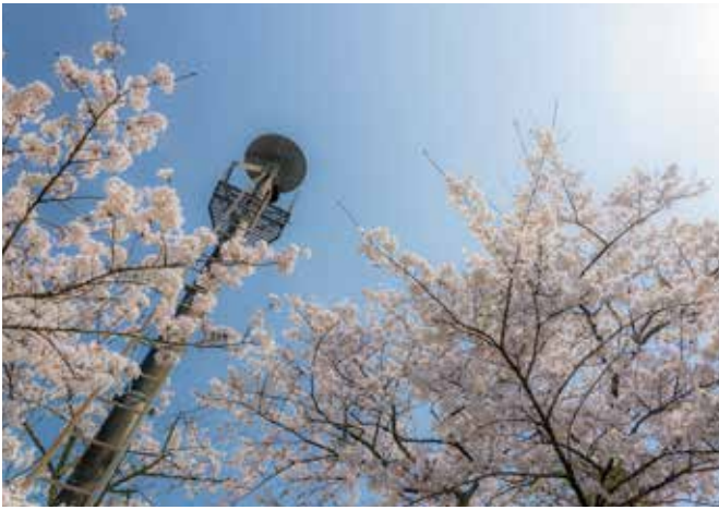
⑬渋川共同墓地（渋川）