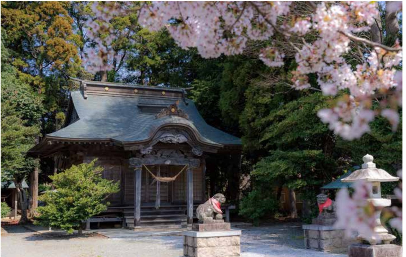
⑭郡山正八幡神社（郡山）