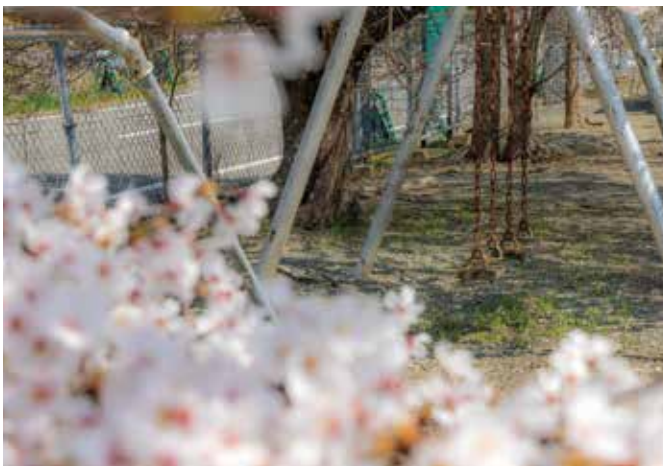
⑪北部コミュニティセンター (鴻草)