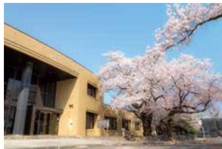
②双葉町図書館（長塚一）