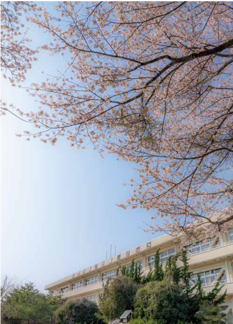
①双葉北小学校（長塚二）

日本を代表する花木である桜。春の風物詩として多くの人々に親しまれており、各地でピンク色の花が景色を彩ります。町の至るところに存在し、景観や生活を豊かにしてきた町の花である桜は、震災以降も多くの町民に愛されています。今年3月から暖かい日が続く、例年より早く満開を迎えました。本号では4月4日に撮影した双葉町の桜の様子を紹介します。