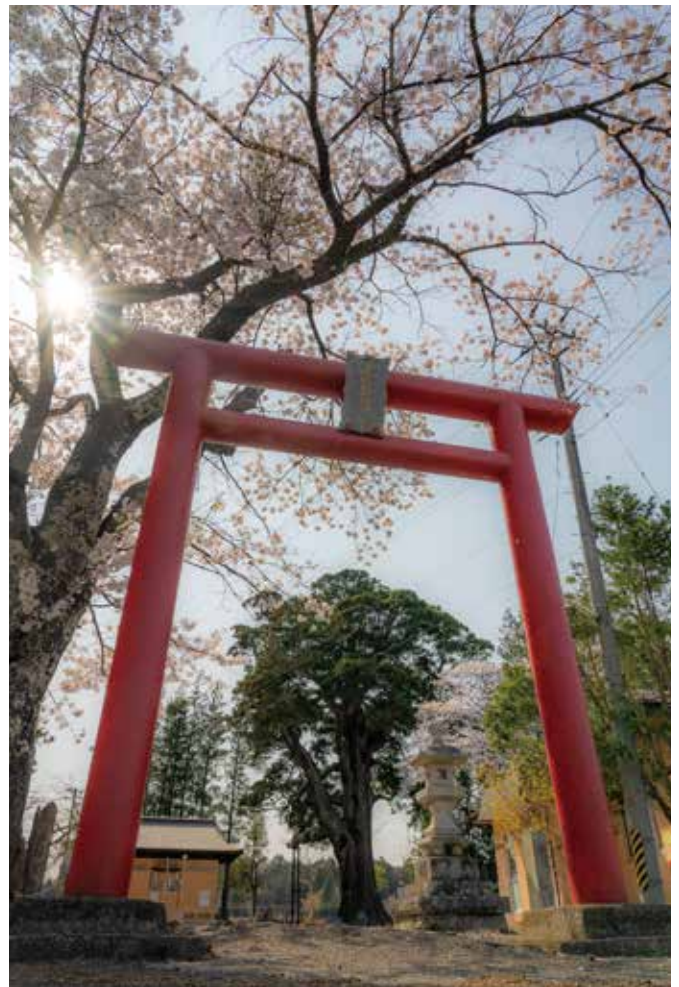
⑨前田稻荷神社 (三字)