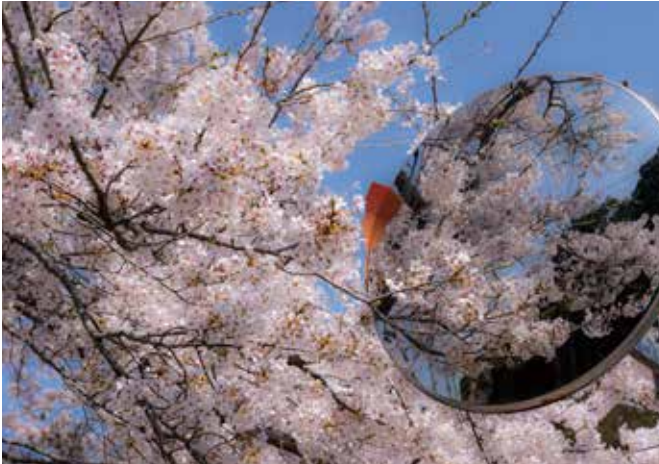
⑭郡山正八幡神社（郡山）