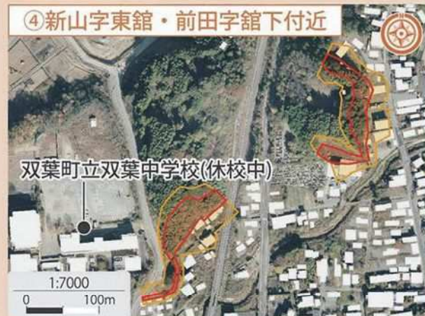
④ 新山字東館・前田字館下付近