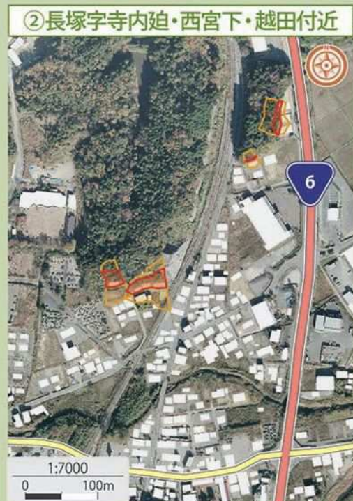
② 長塚字寺内迫・西宮下・越田付近