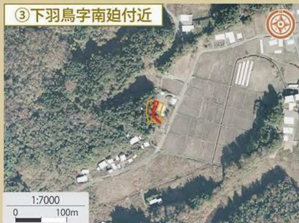
③ 下羽鳥字南迫付近