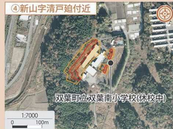
④ 新山字清戸迫付近