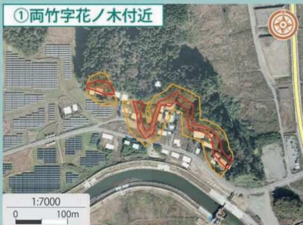
① 両竹字花ノ木付近