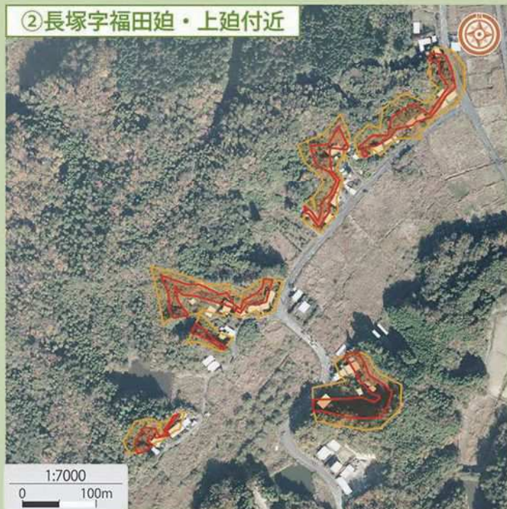
② 長塚字福田迫・上迫付近