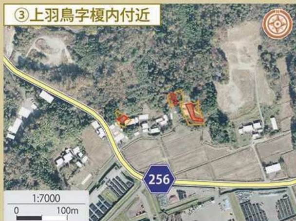
③ 上羽鳥字榎内付近