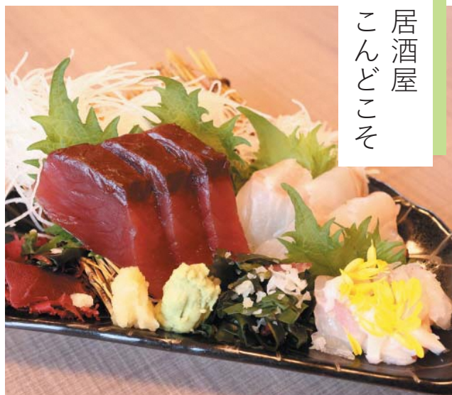
居酒屋 こんどこそ

毎日仕入れる新鮮な刺身は見た目にも鮮やかに美しく盛り付けられています。たっぷりのご飯と日替わりの手作り副菜が花を添え、心を満たす内容となっています。夜は常磐ものに加えて豊富なラインナップの日本酒が味わえます。