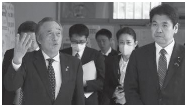
▲双葉南小旧校舎の視察