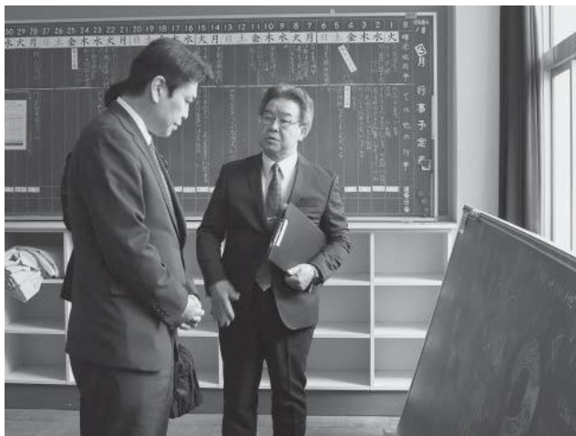
▲当時の状況を説明する館下教育長