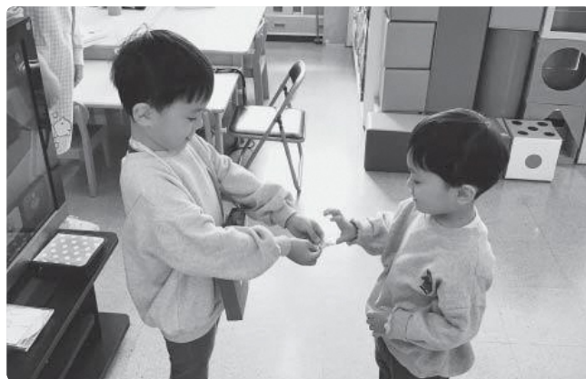
ありがとう、これからもがんばってね。年長児から年少児へプレゼント