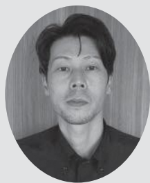
株式会社 fat マネジメント 執行役員

双葉町でも食や宿泊、賑わいづくりに関わる皆さんと連携し、町の復興に関われることに感謝しています。「誠実」を大切に「Happiness for everyone (すべての人に幸せを)」の理念のもと、地域の皆さまとともに歩んでいきたいと考えています。