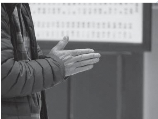
あの日に想いを寄せる静かな祈りの時間。

東日本大震災と東京電力福島第1原発の事故から15年の節目を迎えた3月11日、町は静かな祈りに包まれた。 中野地区では犠牲者を悼む慰霊碑の除幕式を行い、遺族などの参列者が手を合わせた。