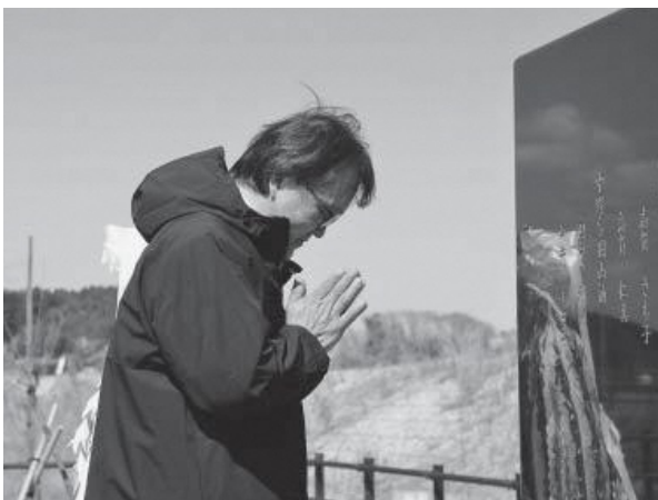
中野地区に建立された慰霊碑。 あの日を想い、手を合わせる。