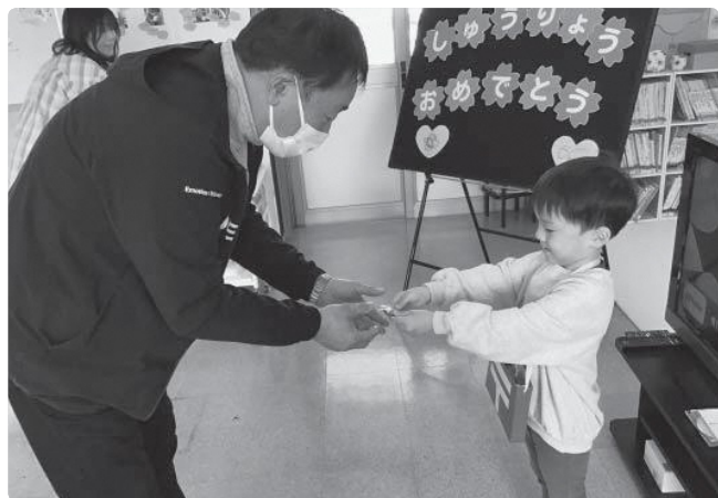
年長児から園長先生へ 感謝の気持ちを形に