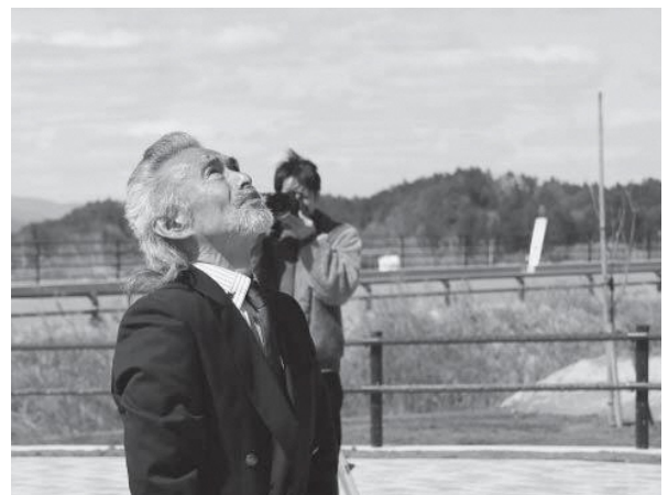
慰霊碑の前で空を仰ぐ。想いは空へ。