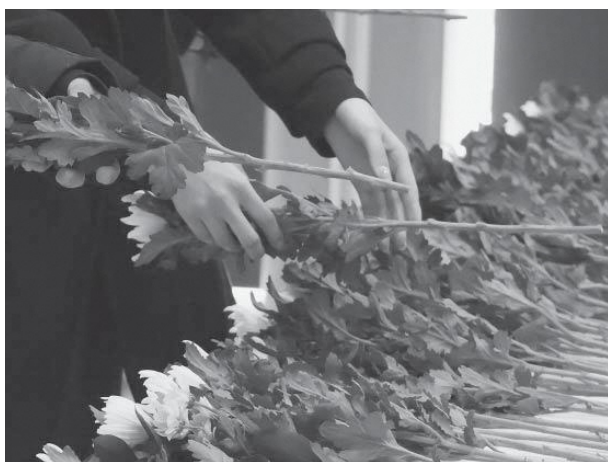
犠牲者への想いが花に託される

東日本大震災と東京電力福島第1原発の事故から15年の節目を迎えた3月11日、町は静かな祈りに包まれた。 中野地区では犠牲者を悼む慰霊碑の除幕式を行い、遺族などの参列者が手を合わせた。