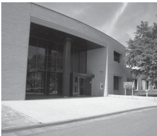
▲震災前の町立図書館

今回の施設見学会や花見が節目となりますので、多くの皆さまのご来場をお待ちしております。