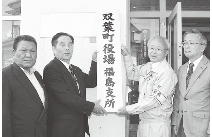
福島支所を開設 10月28日、郡山市朝日二丁目「双葉町役場福島支所」を開設しました。