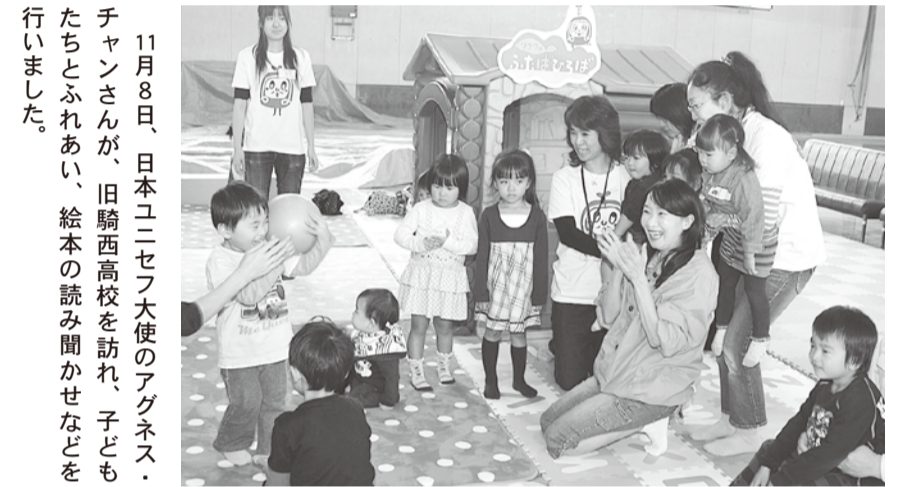
11月8日、日本ユニセフ大使のアグネス・チャンさんが、旧騎西高校を訪れ、子どもたちとふれあい、絵本の読み聞かせなどを行いました。