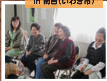
4月2日 演劇ワークショップ in 南台(いわき市)