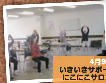
4月9日 いきいきサポートセンター にこにこサロン(加須市)