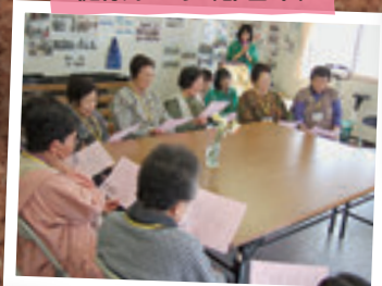
4月16日 喜久田仮設住宅 健康サロン(郡山市)