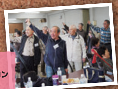
4月18日 小名浜 にこにこサロン (いわき市)