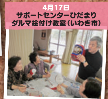
4月17日 サポートセンターひだまり ダルマ絵付け教室(いわき市)