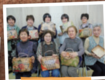
4月16日 さくら仮設住宅 手芸教室(福島市)