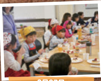
3月27日 ママcafé & こども広場 (加須市)