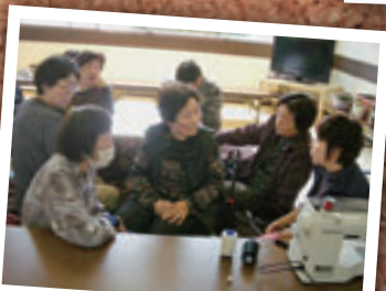
4月17日 いきいきサポートセンター ミシン教室(加須市)