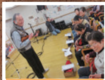
4月18日 サポートセンターひだまり ウクレレ教室(いわき市)