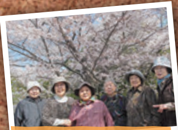
4月11日 サポートセンターひだまり お花見会(いわき市)