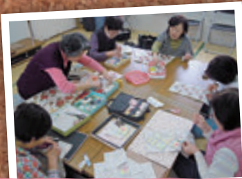
3月31日 会津若松城前仮設住宅 パッチワーク教室(会津若松市)