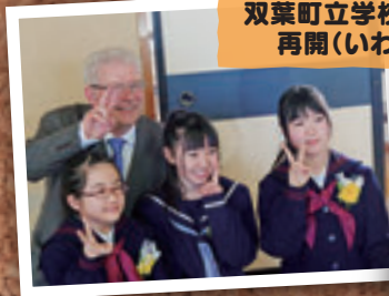
4月7日 双葉町立学校・幼稚園 再開(いわき市)