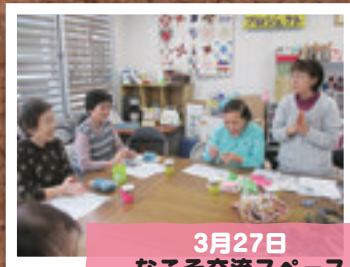
3月27日 なこそ交流スペース 双葉町サロン(いわき市)