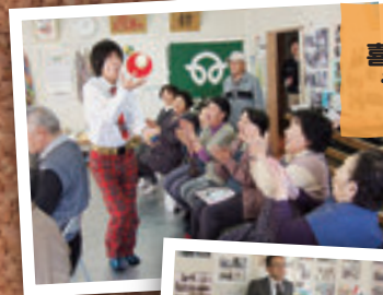
3月28日 喜久田仮設住宅 ラジオ生中継 (郡山市)