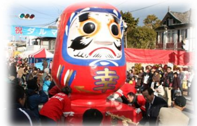
双葉町ダルマ市(巨大ダルマ引き合戦)

(問い合わせ先) 双葉町 いわき事務所 復興推進課 復興推進係 〒974-8212 福島県いわき市東田町二丁目19-4 電話:0246-84-5200(代表) FAX:0246-84-5212