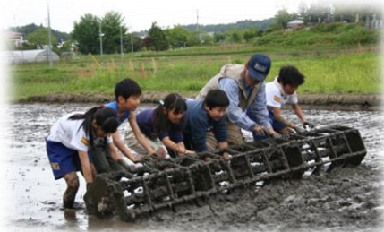
古代米作り講座(田植え体験)