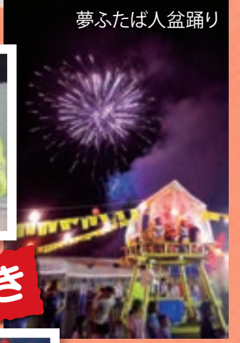
夢ふたば人盆踊り