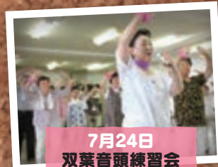
7月24日 双葉音頭練習会 (加須市)