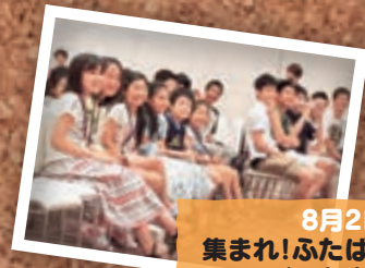
8月2日 集まれ!ふたばっ子2014 (いわき市)