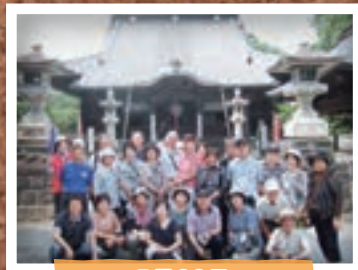
7月22日 合同研修バスツアー (足利市)