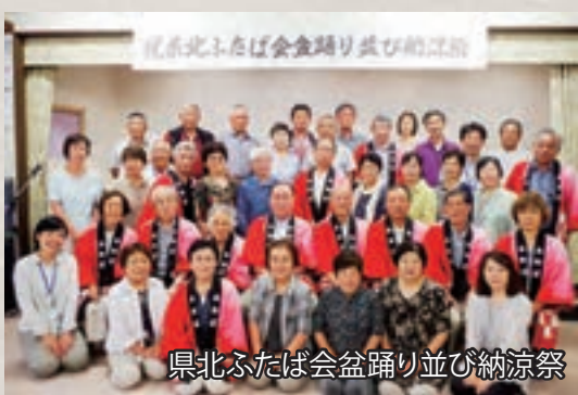
県北ふたば会盆踊り並び納涼祭