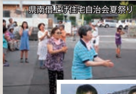
県南借上げ住宅自治会夏祭り