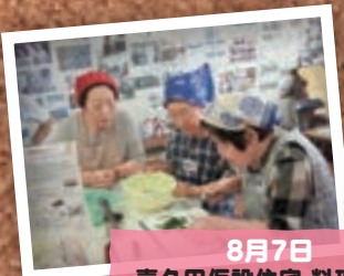
8月7日 喜久田仮設住宅 料理教室 (郡山市)