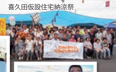
喜久田仮設住宅納涼祭