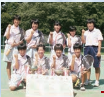
平成22年 第38回 東北ソフトテニス大会