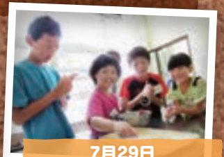
7月29日 ママカフェ&こどもひろば (加須市)