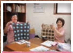
7月31日 せんだん広場 編み物教室 (郡山市)