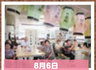
8月6日 いきいきサロン 提灯作り (加須市)