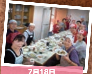
7月18日 第3回 白河男の料理教室 (白河市)