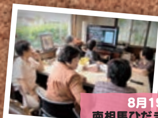
8月19日 南相馬ひだまりサロン (南相馬市)