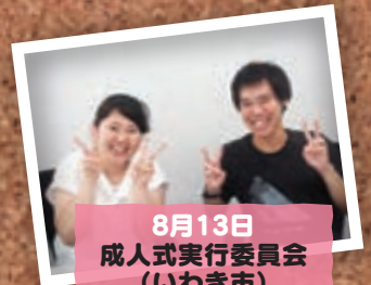
8月13日 成人式実行委員会 (いわき市)