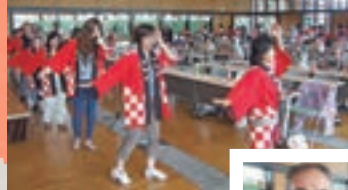
県中地区自治会盆踊り大会