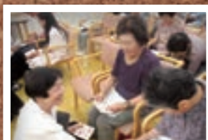
8月19日 サポートセンターひだまり ルルドアンサンブルコンサート (いわき市)