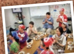
8月19日 会津仮設住宅 料理教室 (会津若松市)