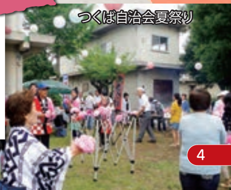
つくば自治会夏祭り