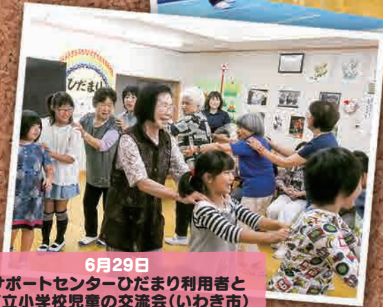
6月29日 サポートセンターひだまり利用者と 町立小学校児童の交流会(いわき市)