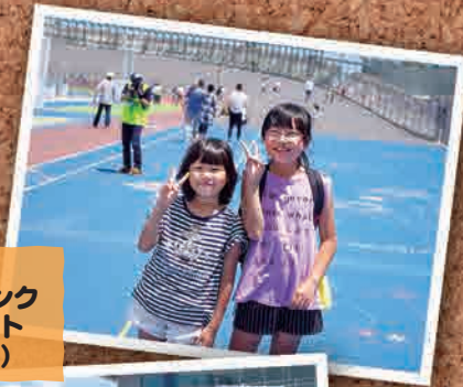
6月20日 平競輪場バンク 開放イベント (いわき市)