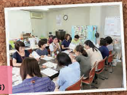
7月8日 ふたば交流広場 ママサロン(加須市)