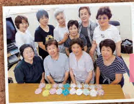
7月15日 さくら応急仮設住宅 手芸教室(福島市)