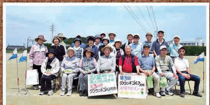
7月13日 老人クラブ連合会 第3回グラウンドゴルフ大会(いわき市)