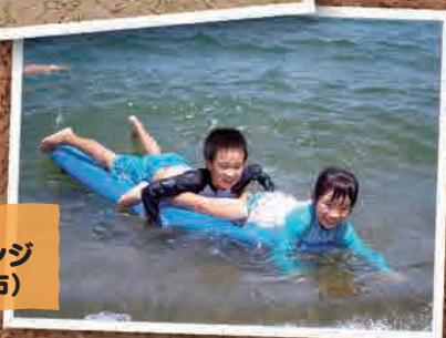
7月12日 サマーチャレンジ in柏崎(柏崎市)