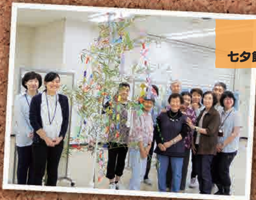
7月3日 ふたばーク 七夕飾りイベント(いわき市)