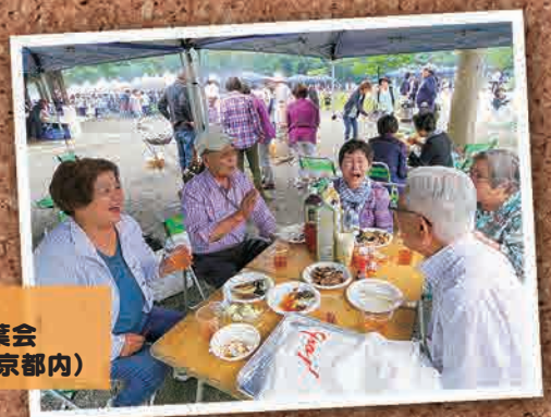
6月5日 東京ふれあい双葉会 バーベキュー大会(東京都内)