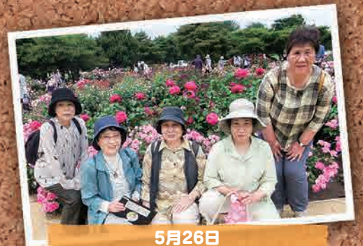
5月26日 いわきまごころ双葉会婦人部 日帰りバスツアー(ひたちなか市)