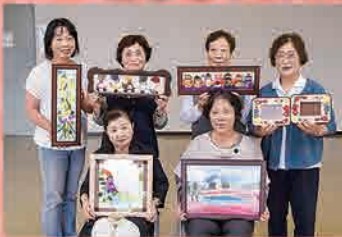
ながよし会手芸教室