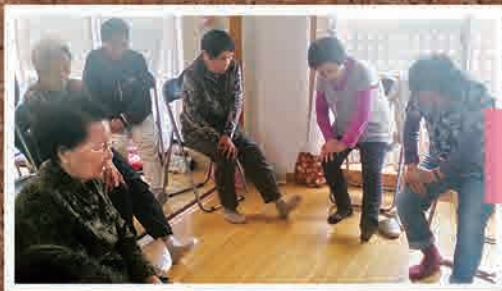
5月25日 八山団地 健康サロン (郡山市)