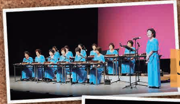
5月21日 いわき文化春祭り JAスマイル大正琴 (いわき市)