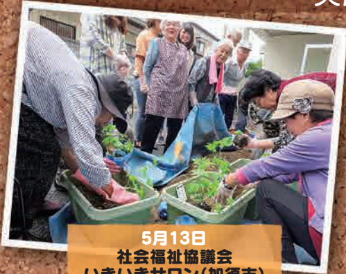
5月13日 社会福祉協議会 いきいきサロン(加須市)