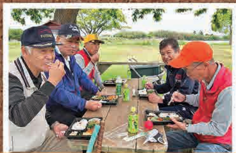
5月21日 第3回双葉町民パークゴルフ大会(いわき市)