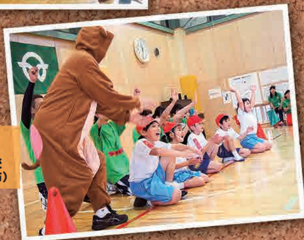
5月28日 ふたば幼稚園・ 双葉南北小学校 運動会(いわき市)