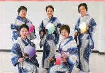
新日本舞踊若幸流やよい会