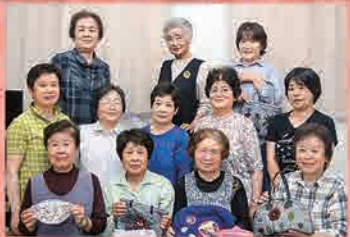
さくら仮設応急住宅手芸教室