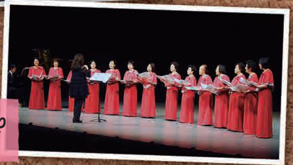
5月21日 いわき文化春祭り コーラスふたば (いわき市)