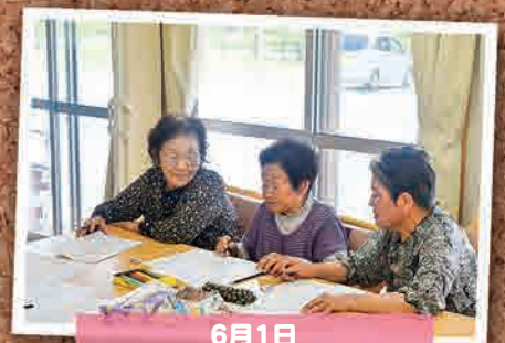
6月1日 サポートセンターひだまり 脳トレ(いわき市)