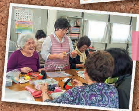
6月2日 あじさいクラブ 手芸教室(いわき市)