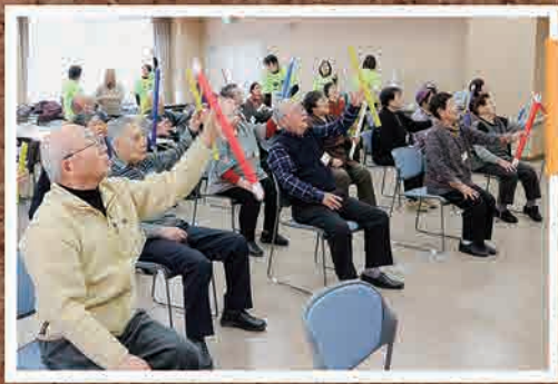
1月24日(火) 社会福祉協議会 出張ひだまりサロン in 南相馬(南相馬市)