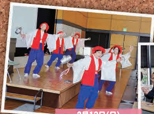
2月12日(日) 県中地区自治会定例会 (郡山市)