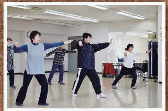
2月2日(木) ふたば一く太極拳(いわき市)