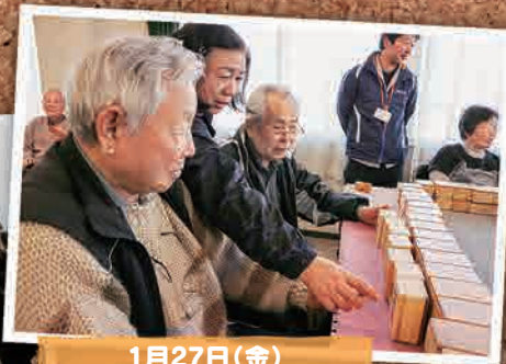
1月27日(金) 県北ふたば会 健康マーじゃん(福島市)