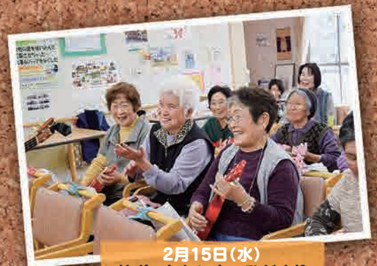
2月15日(水) サポートセンターひだまり ウクレレ教室(いわき市)