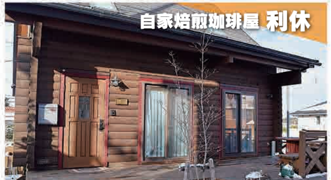
自家焙煎珈琲屋 利休