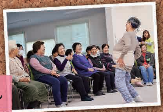
1月26日(木) 社会福祉協議会 出張ひだまりサロン in 平(いわき市)