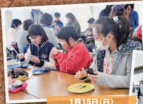
1月15日(日) ベビーベア作り & 埼玉自治会餅つき大会 (加須市)