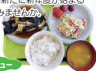
この日のメニュー