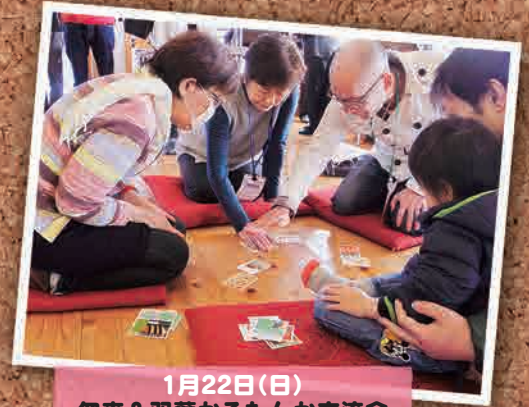
1月22日(日) 勿来 & 双葉かるたんか交流会 (いわき市)