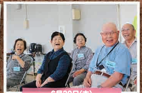
6月29日(木) ひだまりサロン(いわき市)