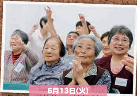
6月13日(火) 社協サロン(白河市)