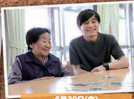
6月30日(金) かるたんか交流会(いわき市)