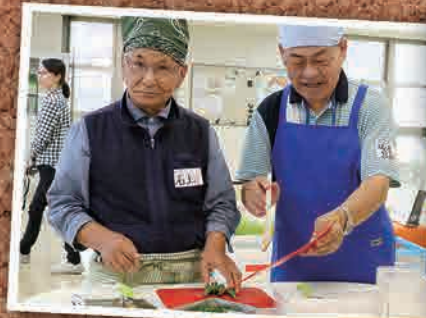
6月21日(水) 男の料理教室(いわき市)