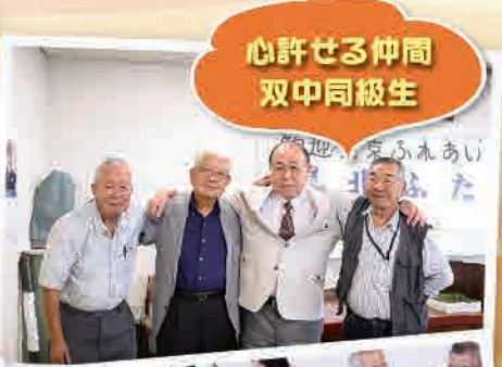
心許せる仲間 双中同級生