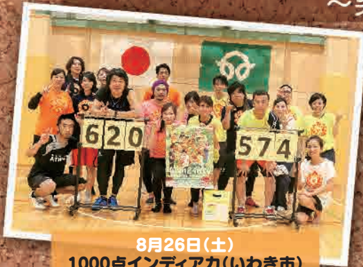
8月26日(土) 1000点インディアカ(いわき市)