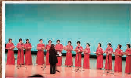
9月3日(日) 福島県芸術祭開幕式典・行事(相馬市)