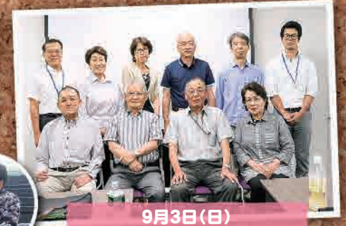
9月3日(日) タブレットコミュニティ集会 (東京都)