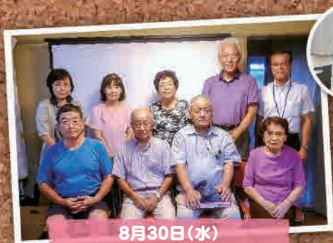
8月30日(水) タブレットコミュニティ集会 (つくば市)