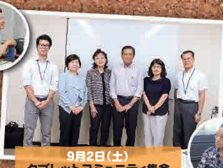
9月2日(土) タブレットコミュニティ集会 (横浜市)