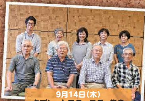
9月14日(木) タブレットコミュニティ集会 (郡山市)