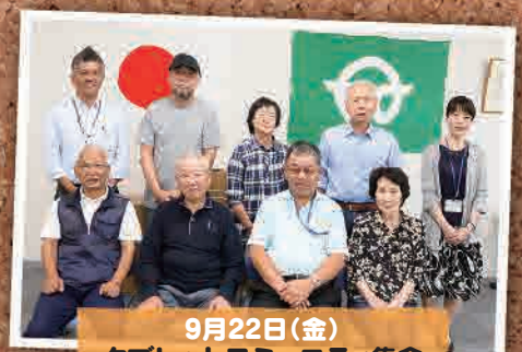
9月22日(金) タブレットコミュニティ集会 (いわき市)