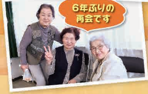
6年ぶりの再会です