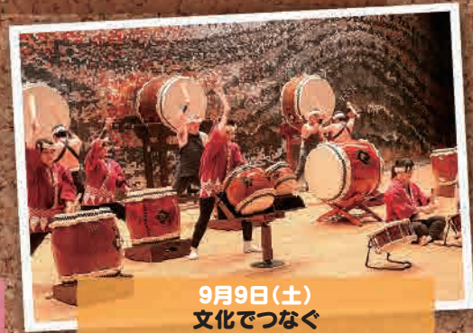
9月9日(土) 文化でつなぐ ふるさとトークイベント(郡山市)