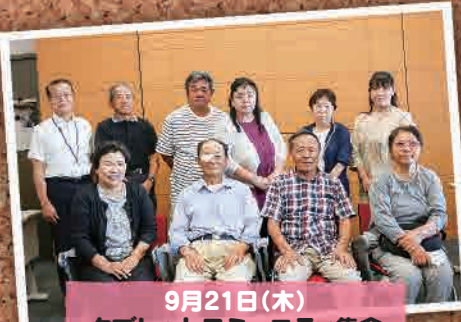
9月21日(木) タブレットコミュニティ集会 (加須市)