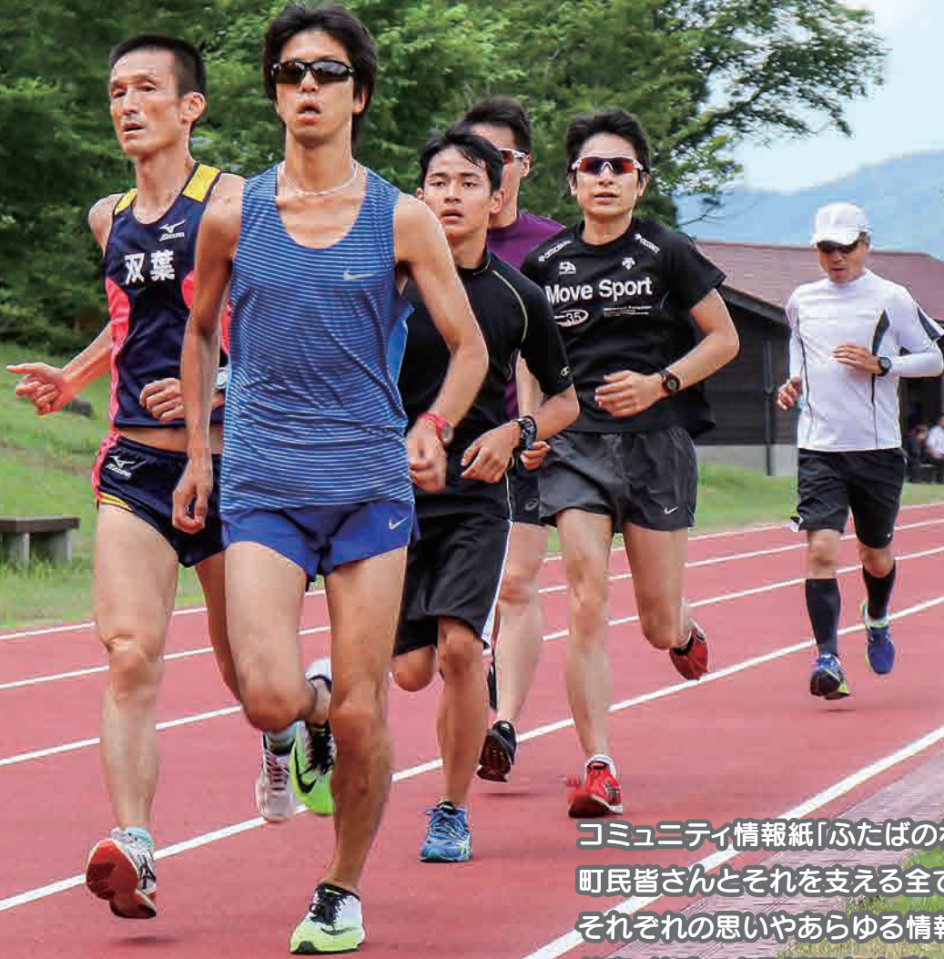
表紙は双葉町駅伝チーム夏合宿より(北塩原村)

コミュニティ情報紙「ふたばのわ」は、町民皆さんとそれを支える全ての人を巻き込みそれぞれの思いやあらゆる情報に共有・共感できる紙面をめざしています。月に一度、ふたばのわのページをめくってみんなで一緒に笑顔になりませんか。