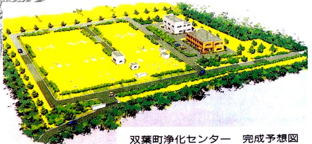
双葉町浄化センター 完成予想図