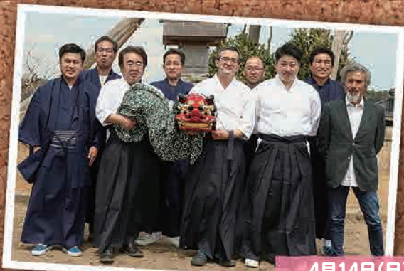
4月14日(日) 浜野はまなす会 神楽奉納 (双葉町浜野地区)