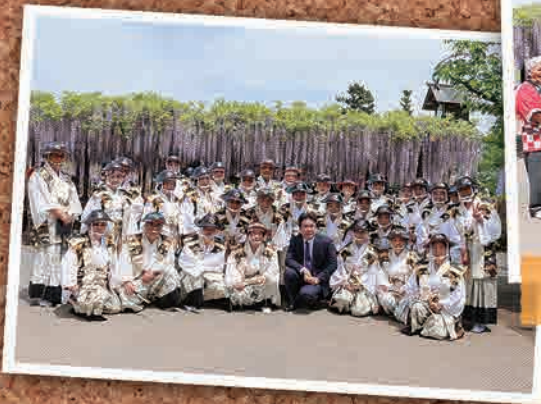
4月28日(日)～5月5日(日) 騎西藤まつり(加須市)