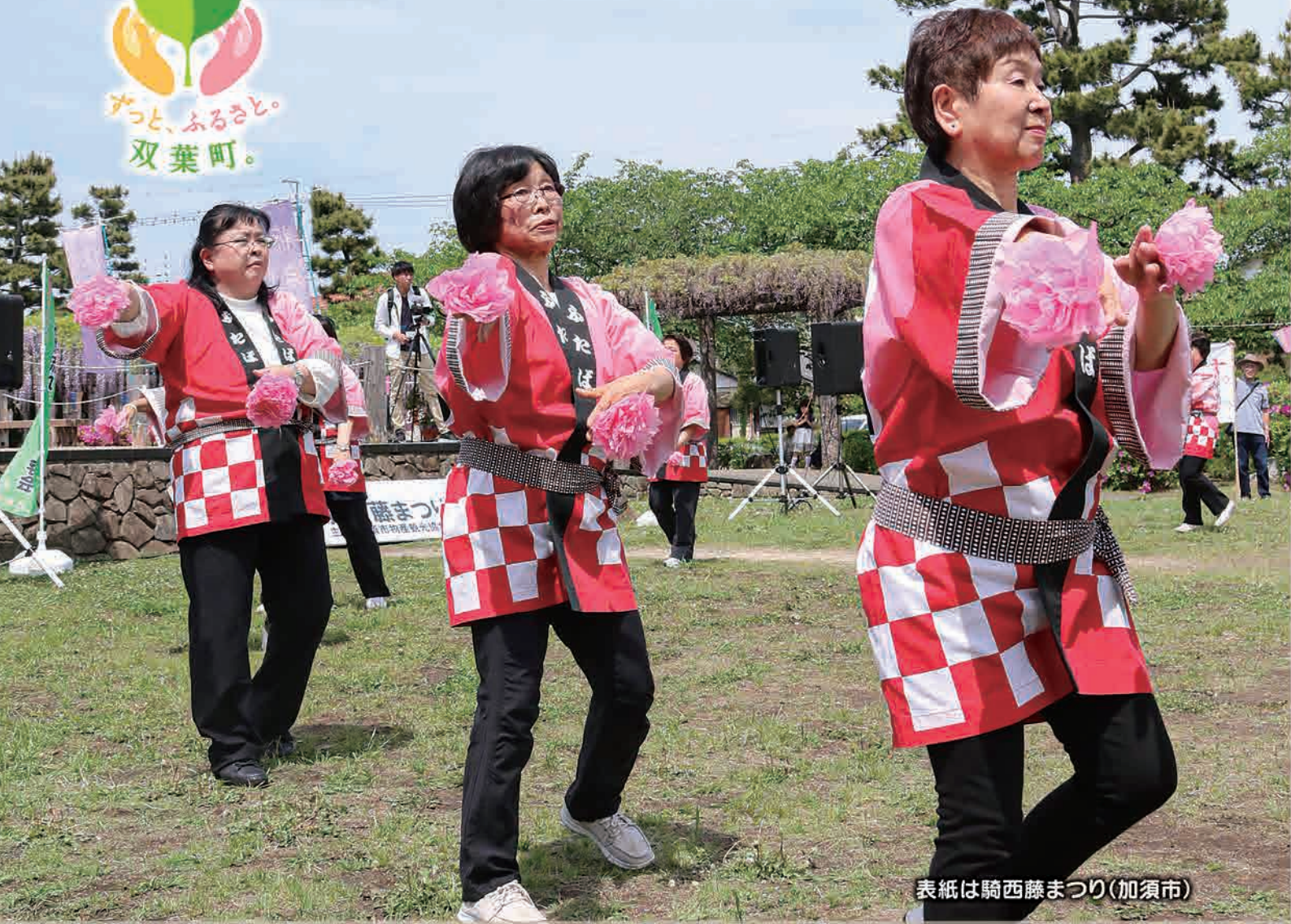
表紙は騎西藤まつり(加須市)