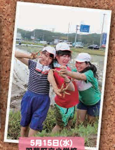
5月15日(水) 双葉町立小学校 田植え (いわぎ市)