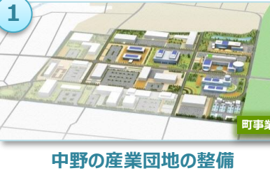
中野の産業団地の整備