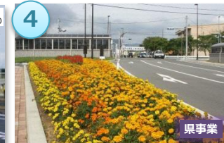
復興シンボル軸 (アクセス機能確保)