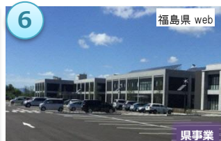
アーカイブ拠点施設