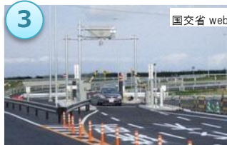
(仮称) 双葉 IC