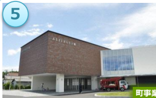
産業交流センター