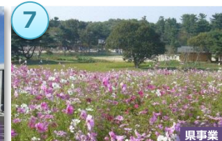
復興祈念公園 (一部)