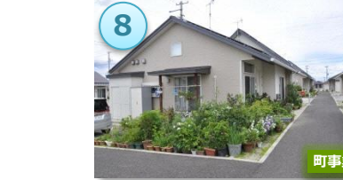
駅西の住宅団地の整備

「新たな産業・雇用の場」と連携した 「新たな生活の場」の確保・「既成市街地の再生」