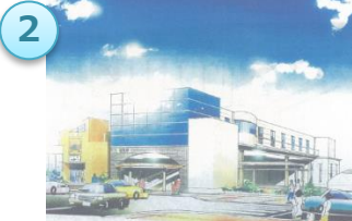
JR 双葉駅と自由通路の整備